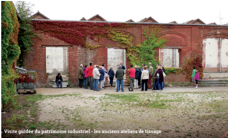
Visite guidée du patrimoine industriel - les anciens ateliers de tissage