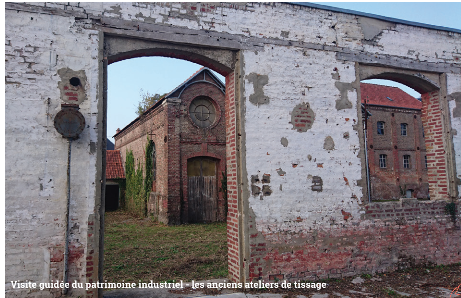
Visite guidée du patrimoine industriel - les anciens ateliers de tissage