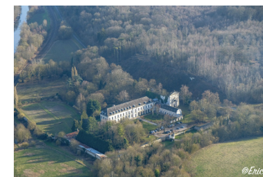
Vue aérienne de l'ancienne abbaye

• Comité départemental de la randonnée pédestre de la Somme : https://somme.ffrandonnee.fr , somme@ffrandonnee.fr .