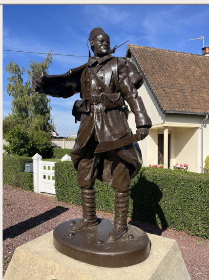
Sculpture d'un tirailleur sénégalais

Le 11 septembre 2021, la commune de Crouy-Saint-Pierre a inauguré un monument érigé en l'honneur des tirailleurs sénégalais tombés pour la France lors des combats de juin 1940. La sculpture, en résine composite, a été réalisée par le sculpteur Olivier Briquet. Il a représenté le tirailleur sénégalais en uniforme, le fusil sur l'épaule, coiffé d'une chechia et tenant à la main une machette. Le réalisme parfait a été obtenu à partir du moulage des mains et du visage d'un jeune amiénois originaire de Guinée.