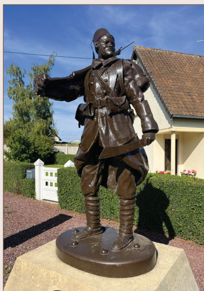
Sculpture d'un tirailleur sénégalais

Le 11 septembre 2021, la commune de Crouy-Saint-Pierre a inauguré un monument érigé en l'honneur des tirailleurs sénégalais tombés pour la France lors des combats de juin 1940. La sculpture, en résine composite, a été réalisée par le sculpteur Olivier Briquet. Il a représenté le tirailleur sénégalais en uniforme, le fusil sur l'épaule, coiffé d'une chechia et tenant à la main une machette. Le réalisme parfait a été obtenu à partir du moulage des mains et du visage d'un jeune amiénois originaire de Guinée.